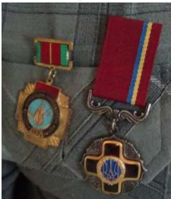
Орден «За мужність» і медаль учасника ліквідації аварії на ЧАЕС