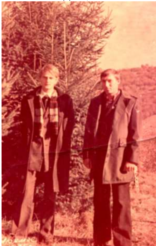
Фото з колегою на курорті у місті Яремче, 1975 рік